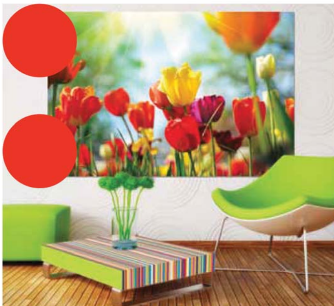
Trang trí nội thất