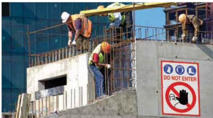
Bảng chỉ báo an toàn

Anapurna M2540 FB được xây dựng dựa trên kiến trúc máy in phẳng thực thụ nên có thể in trên hầu hết các vật liệu dạng cứng hoặc dạng tấm phẳng. Các đầu in mực trắng và 6 màu (CMYK LmLc) với dung tích hạt mực 12pl đem đến bản in chất lượng cao cấp, mang lại lợi thế cạnh tranh cho chính bạn và cả khách hàng. Việc có thể in trên nhiều vật liệu với các kích cỡ khác nhau, Anapurna M2540 là chiếc máy lý tưởng cho các công việc lặp đi lặp lại. Hãy liên hệ ngay với đại diện thương mại của Agfa Graphics tại địa phương và chúng tôi sẽ chứng minh cho bạn thấy khả năng hoàn vốn nhanh và ý nghĩa của "lợi nhuận" từ dòng máy Anapurna M2540.