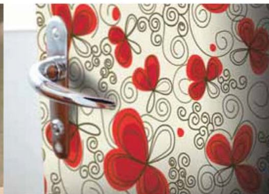
Trang trí nội thất - in trên gỗ